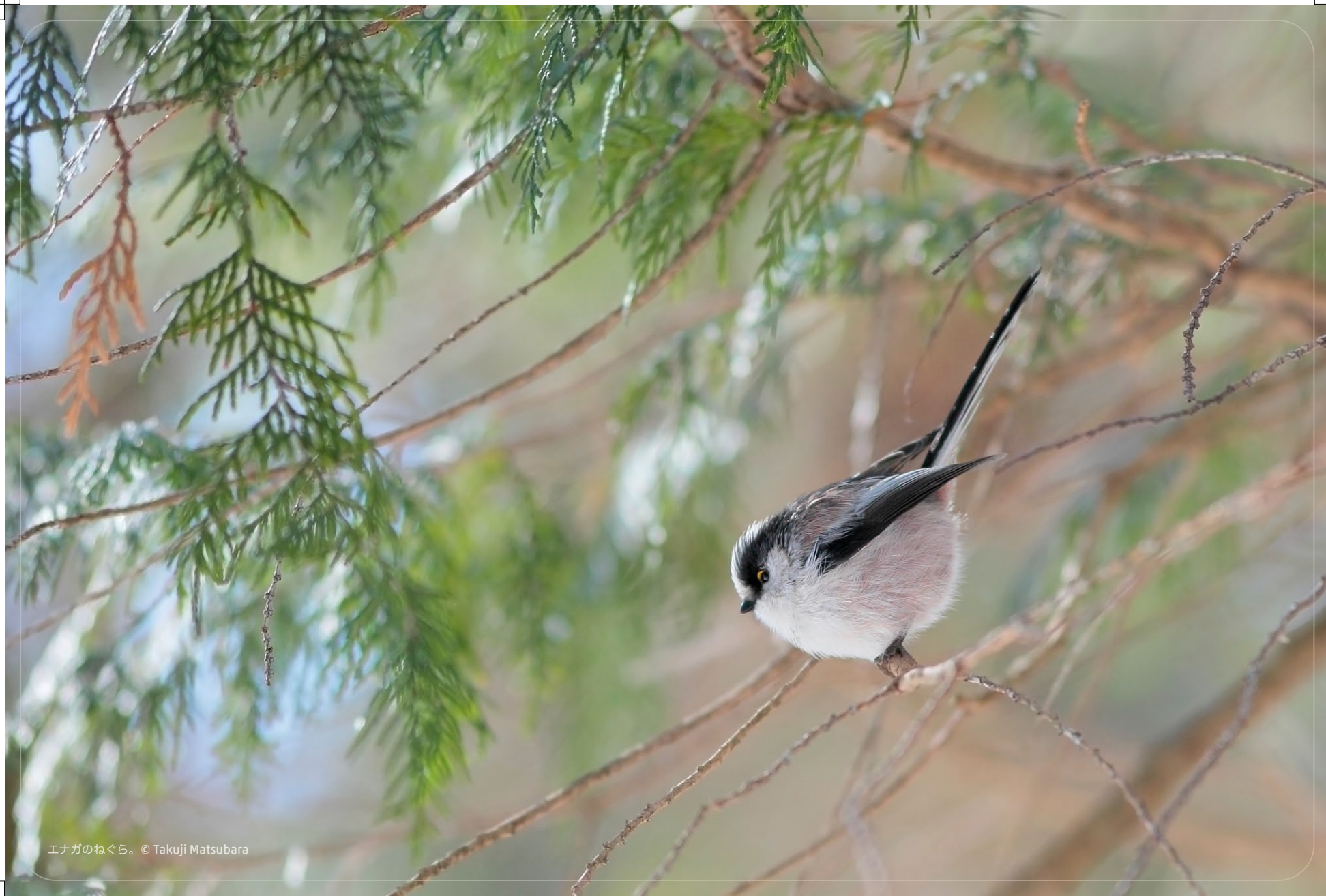
エナガのねぐら。